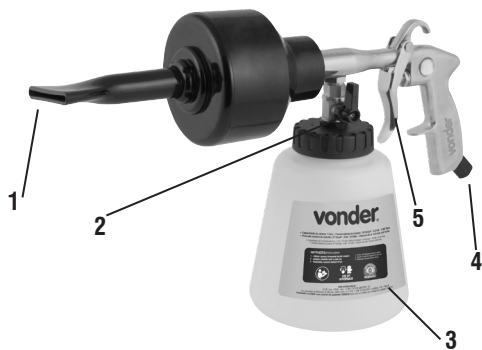
Fig. 1 – Componentes