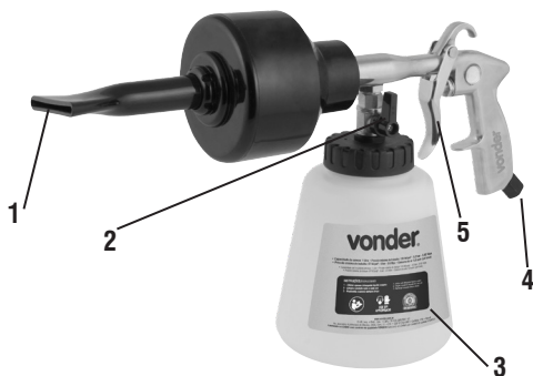
Fig. 1 – Componentes